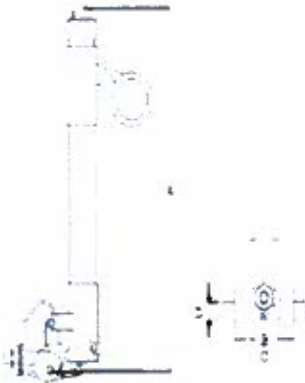
Tabla 2: Características Dimensionales del tubo portafusible.

El ancho de la base del tubo porta fusibles a verificar será el que marca la siguiente figura: