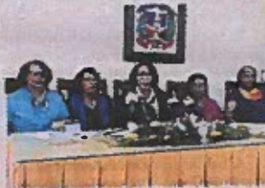
Representantes de la nueva gestión. ■