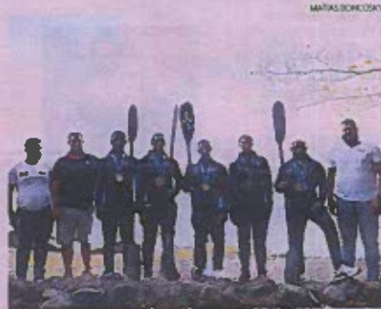
Integrantes del equipo dominicano de remo y canotaje.

Fue en este lugar donde el pasado 7 de julio se hizo historia con el primer metal dorado de República Dominicana en canotaje sprint kayak cuádruple 500