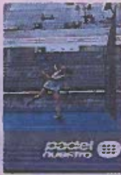
Pádel va en crecimiento.

Empresa dueña de los Yanqui ha invertido en este deporte